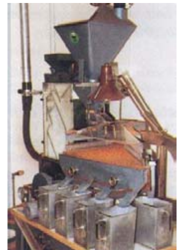
Gravitationsskakbord för frörensning och fraktionering.