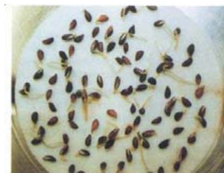
Granfrö på gröningsbord efter 6 dygn.

Fröpartiernas egenskaper kan förbättras avsevärt med de fröbehandlingsmetoder som har utvecklats vid Sveriges lantbruksuniversitet i Umeå. Metoderna har anpassats till storskalig drift vid SkogForsk i Sävar, där huvuddelen av det frö som används i landets täckrotsplantskolor behandlas. I detta Resultat beskrivs översiktligt vilka metoder som används vid SkogForsk för kott- och fröanalyser samt för förbättring av fröpartier.