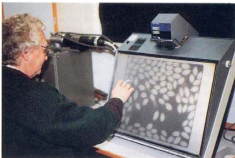
Röntgenanalys av ett fröprov.